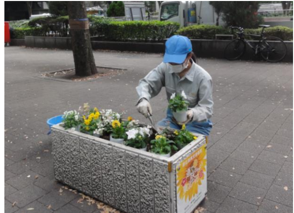
『道で咲かせよう東北の花』プロジェクト 4号街路植替え