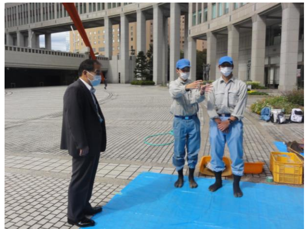
教育庁幹部職員に花壇の説明