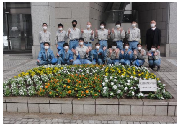
花壇の完成！ みんなで記念写真