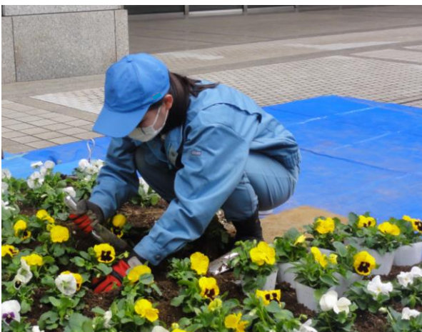
東京都庁都民広場花壇の秋季花植え

綺麗な花壇や寄せ植えのプランターは、都民広場を訪れる人々を笑顔にしてくれると思います。農業高校での学びが社会に大いに貢献しています。