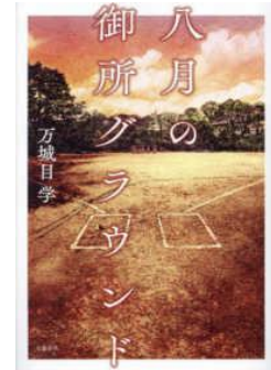
『八月の御所グラウンド』 万城目学 文藝春秋 913.6-マ