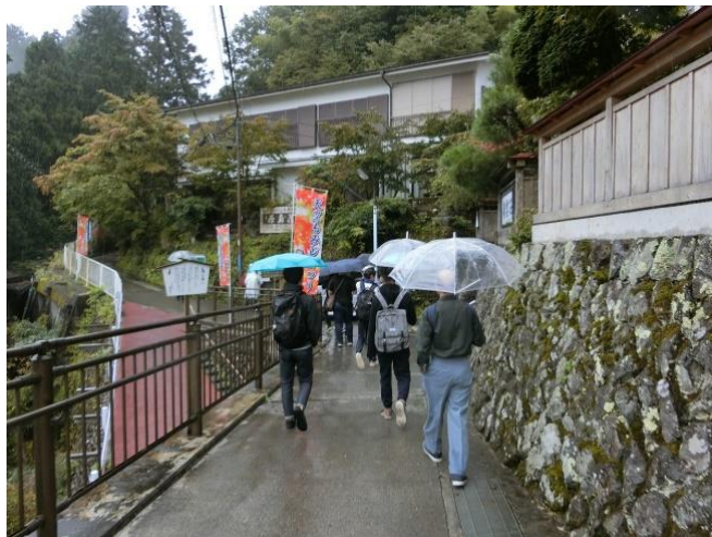
武蔵御嶽神社を目指します。