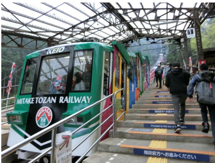
ケーブルカー武蔵号