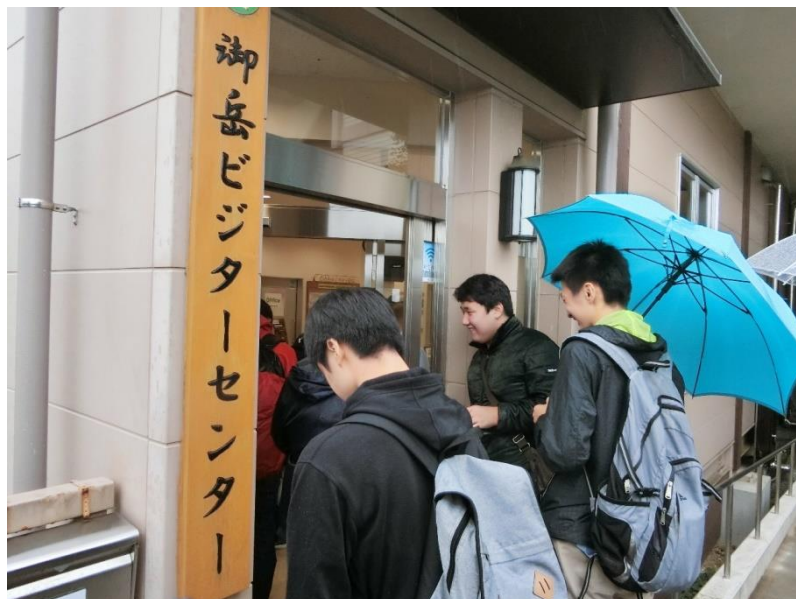
食事後、御岳ビジターセンターを見学しました。