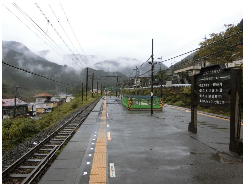
御嶽駅ホームからの景色。