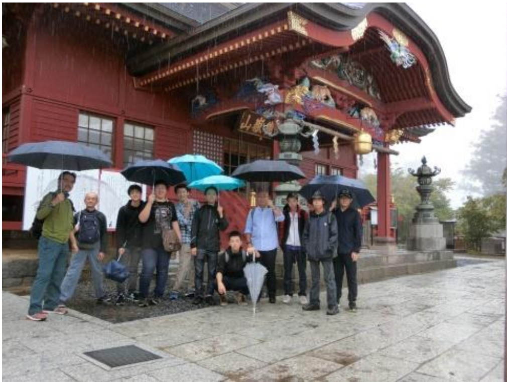
神社本殿前で記念撮影