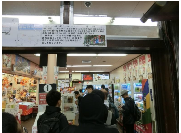
滝本駅からケーブルカーに乗車です。