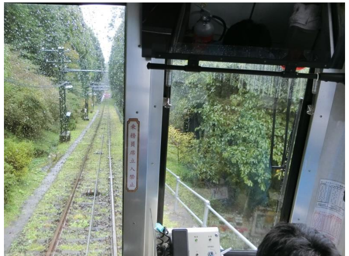
ケーブルカーからの車窓。