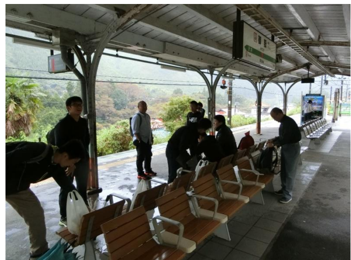
滝本駅のお土産屋に寄って、新宿で解散しました。