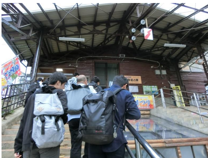
御岳山駅は標高831mです。