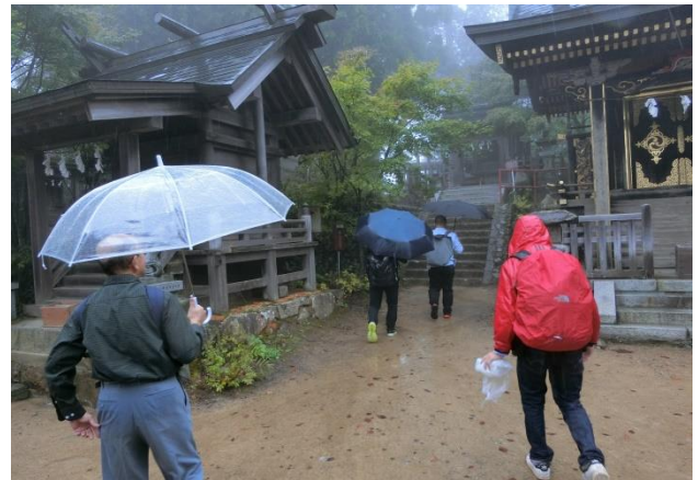
神社本殿周辺を散策。