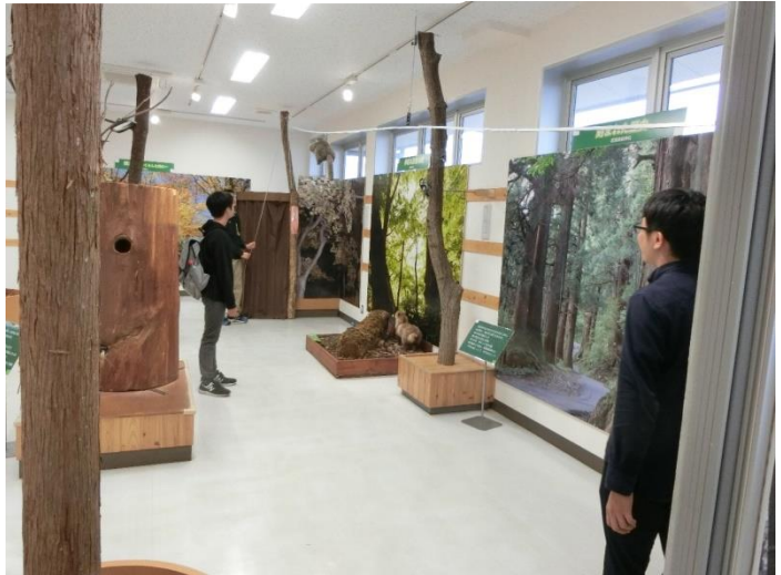
周辺の地形や生息している動物や植物についてのコーナーもありました。