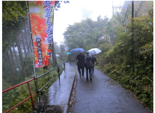
帰りは女坂から下りました。