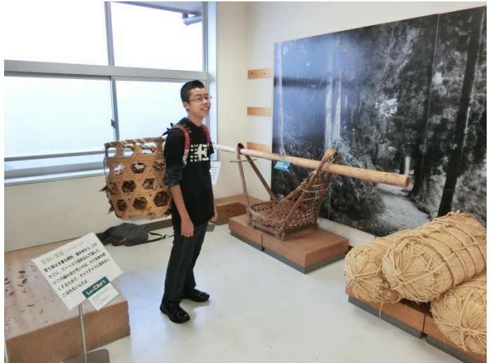
昔の生活を体験するコーナーもあります。