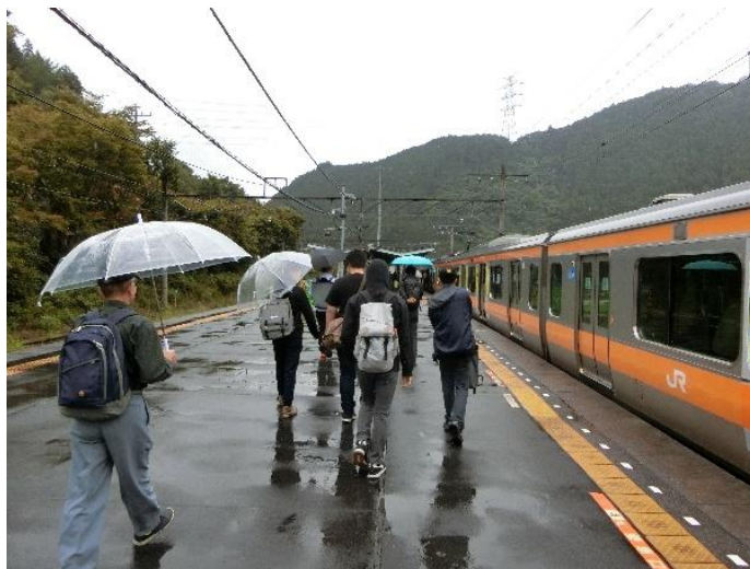
御嶽駅に着くと小雨でした。