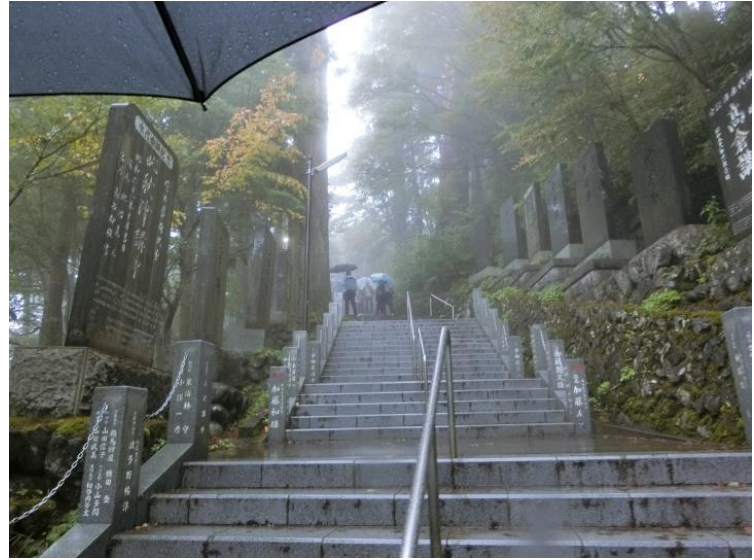
長い石段を登ります。