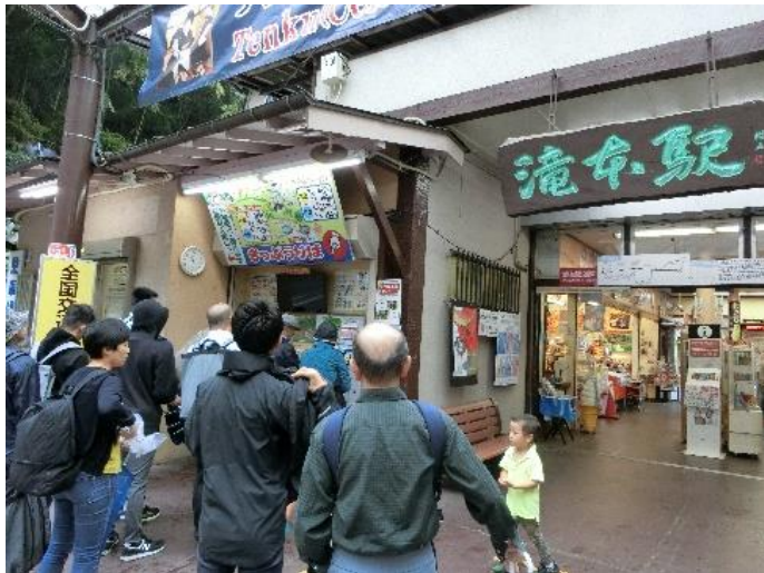
御嶽駅からバスで滝本駅へ。