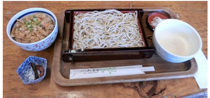
昼食はそば屋で食事しました。