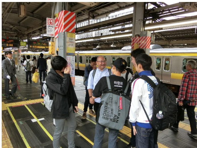
新宿駅で集合しました。