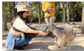
クイーンズランド州 ゴールドコースト