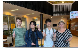
ホームステイ & 学校交流