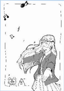
合唱祭パンフレット表紙

普段からにぎやかなクラスで、1人1人がしっかり声を出して歌うことができました。そこから音程や強弱、曲の雰囲気を考え、最後には発声方法も意識しました。その結果、合唱祭までクラス全員で真剣に楽しく歌うことができ、総合優勝することができました！(2-1)