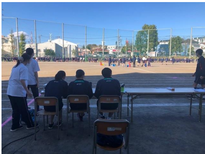
生徒が運営します！