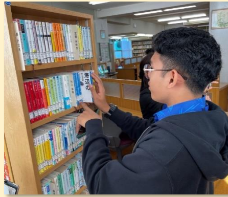
図書館の見学で村上春樹を発見！