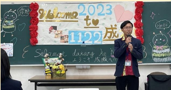
マレーシア高校生より Farewell speech