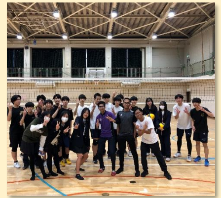
練習が終わり、全員でポーズ！