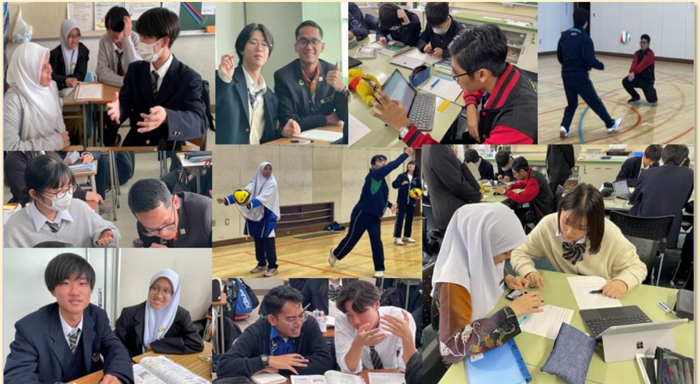
数学・音楽・体育・英語・地理・保健などの授業に参加しました。

◆世界って広いのに意外と身近だと思った。他言語を使い、文化も全く違うけど私達と同じように彼らも高校生として勉強して、運動やスポーツをやって、遊んで色々なことをやっていると思うと、とても嬉しかった。これからももっと異文化や異国の地に触れたい。