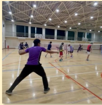
成瀬のパディとラリー練習