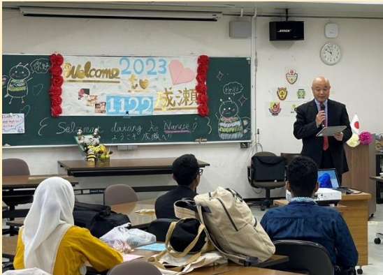
高野校長より歓迎の挨拶