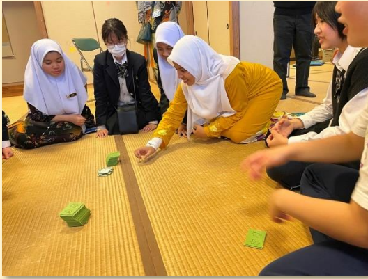
競技かるたのデモを見学後に、坊主めくりに挑戦