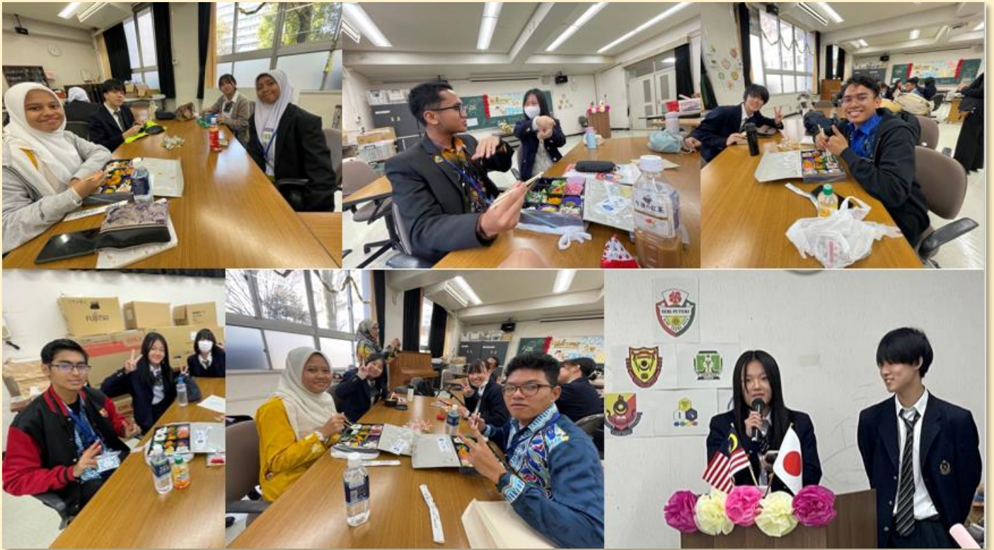
2年生の探究ゼミにてマレーシア高校生をお迎え、自分のテーマや中間発表を紹介しました。