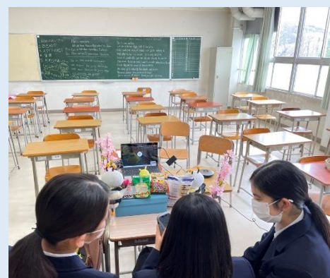
なるべく黒板は見ないで進めよう！

◆オーストラリアの公立学校では、最近「登校時にスマートフォンを先生に預け、下校時に受け取る指導が開始されたそうです。」先生によると、実際