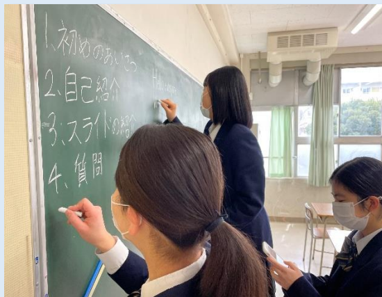
黒板に予定を記入してみました！