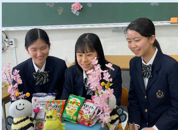
沢山準備をしたけれど、本番はあっという間でした！