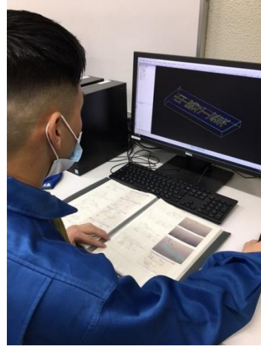
【3次元CG実習：アニメーションプログラムの作成風景】