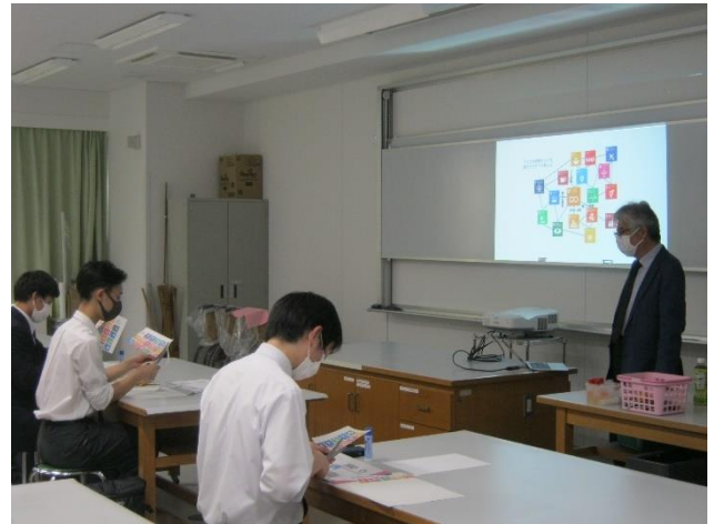
↑SDGsのゴールがどのように関連づいているかマップ作りをしました。