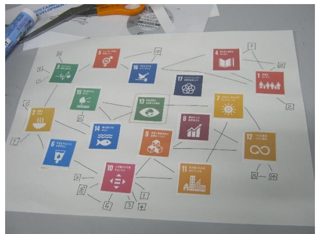
各自イメージマップを仕上げ、SDGsについて考えることができました