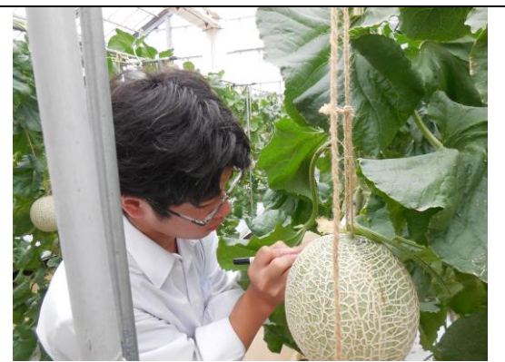
【収穫の準備】 収穫に向けて、果実のついている節の位置等を記録しています。