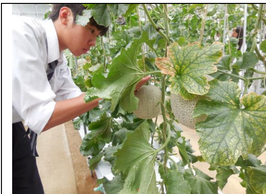
【収穫の準備】 受粉日を確認し、収穫予定日をチェックしています。