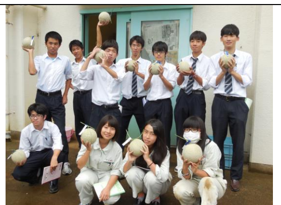
【メロンの収穫】 3月に種子を播き、受粉から約60日、ついに収穫の日を迎えました。感動！