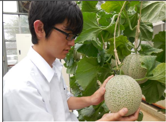
【玉吊りの様子】 手のひらを超える大きさになってきました。