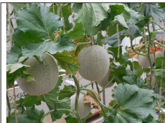
【収穫を待つメロン】 一株あたり、2つに厳選したメロンの果実です。