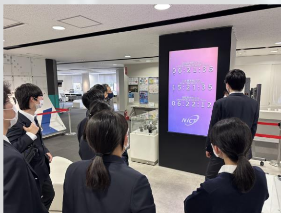
日本標準時（JST）の決定

災害時に迅速に地上の様子を把握できるという技術は今後も活躍しそうだと思った。特に火山の噴煙を無視できたり、15cm単位で観測できるのは凄いと思った。