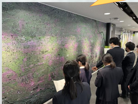
航空機搭載合成開口レーダー（Pi-SAR）によって撮影された東京の航空写真

災害時に迅速に地上の様子を把握できるという技術は今後も活躍しそうだと思った。特に火山の噴煙を無視できたり、15cm単位で観測できるのは凄いと思った。