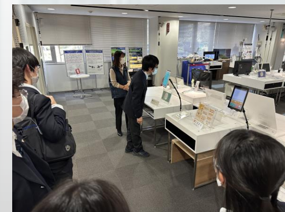
多言語翻訳ソフトVoiceTra

グローバル化により、英語を話せない人にとっては言語が大きな障害になっていたが、それを解決・改善するための有力な手段が生まれたのだということを感じることができた。まるで近未来を見ているかのような体験だった。