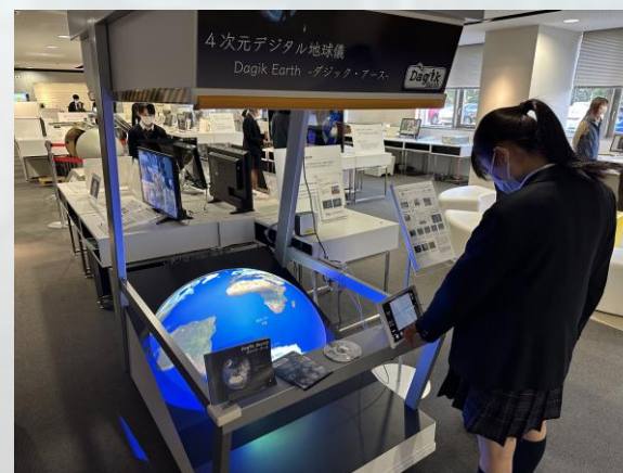
4次元デジタル地球儀