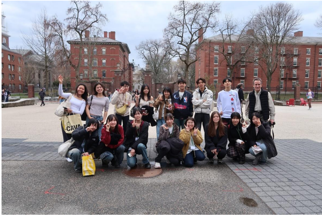
Harvard University Phillips Brooks House での研修