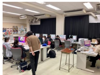
韓国の高校とのオンライン交流の様子