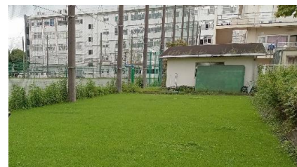
校内で整備された芝生の様子