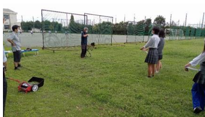
芝生での講義の様子