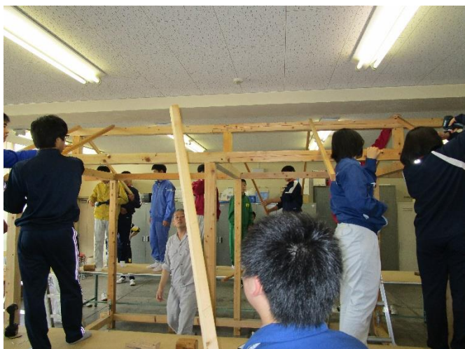
木造住宅の軸組の組立てと解体