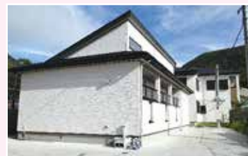
村営学生寮「しらすな寮」

寮では、掃除や洗濯などをはじめ、週末は当番制で食事をつくるなどして生活しています。寮生全員での共同生活ですので、個人が規則正しい生活を送りながら、お互いに気持ち良い生活が送れるような配慮をしています。