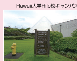
Hawaii大学Hilo校キャンパス

全日制は普通科と併合科(園芸科・家政科)を設置しています。東京都立大学や都立産業技術大学院大学と連携したキャリア教育やオンラインチューター制度による進路学習支援、八丈島の魅力化を追求する探究学習、Hawaiiの大学や高校との交流によるグローバル人材の育成に力を入れています。吹奏楽部や写真部が全国大会へ出場するなど部活動も盛んです。