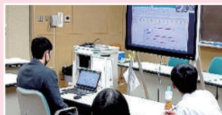
ITを活用した探究学習で島内外から八丈島を支える人材を育成