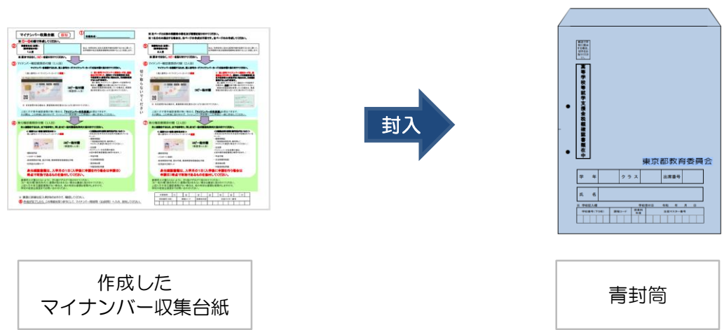
作成した マイナンバー収集台紙