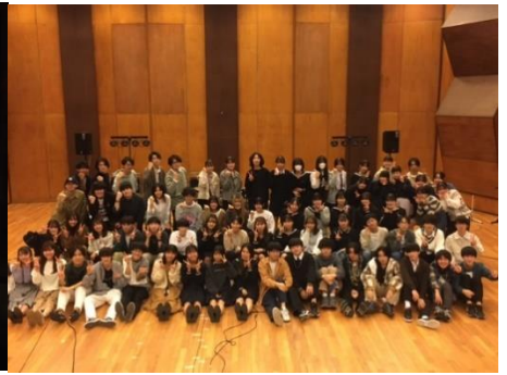
○11月28日 第14回東京都高校対抗バンドフェスティバル(特別賞受賞!) 特別賞 優秀賞(さんになんぽっちとココナッツ)