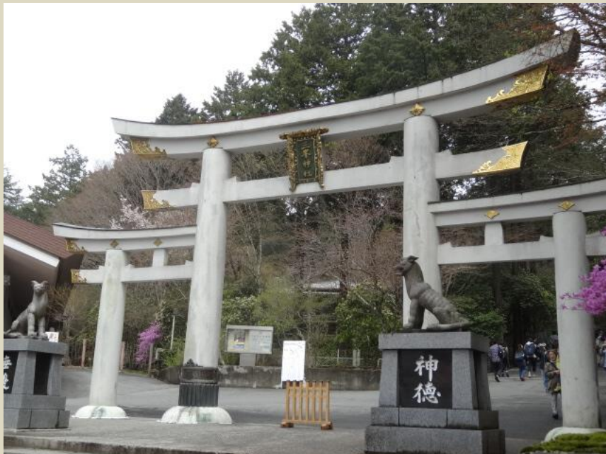
←三峯神社にある三ツ鳥居

秩父の「三峯神社」「秩父神社」「宝登山神社」を巡る旅。テスト前だったので、神様のご利益をあやかろうというもくろみも…？！