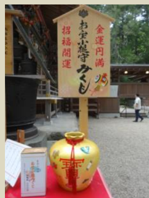
↓宝登山神社のおみくじ