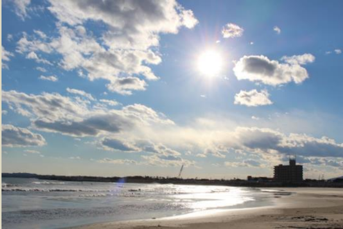
←四倉漁港付近の海岸