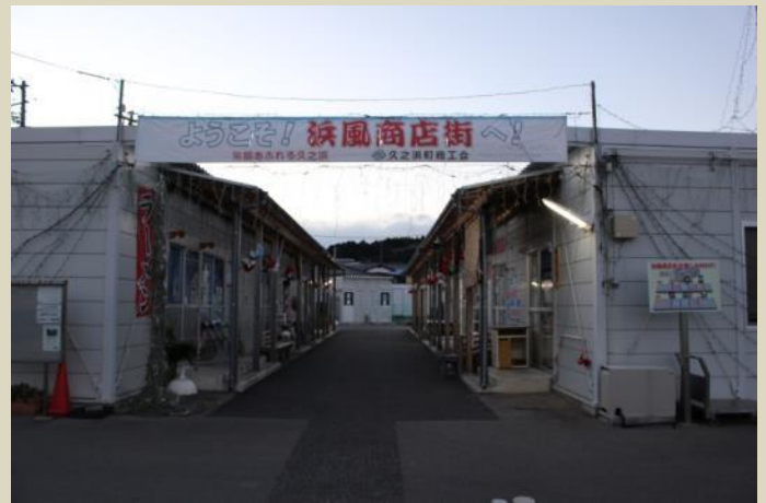
↓久ノ浜の復興商店街