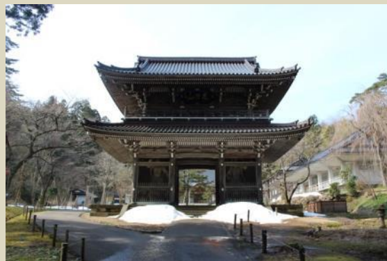
←上杉謙信が預けられた林泉寺