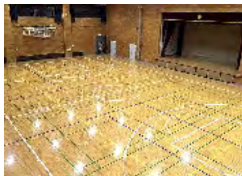
体育棟1階 第2アリーナ