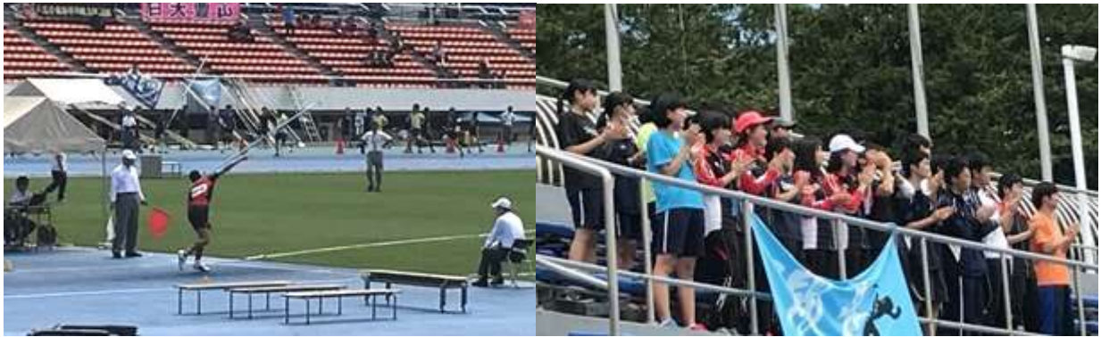
3年榎本くん/全力で応援するチーム国分寺

この大会から集団応援という新しい試みをしました。みんなで声を合わせて応援することで、いつも以上にチーム国分寺として団結し、都大会に挑めたと思います。