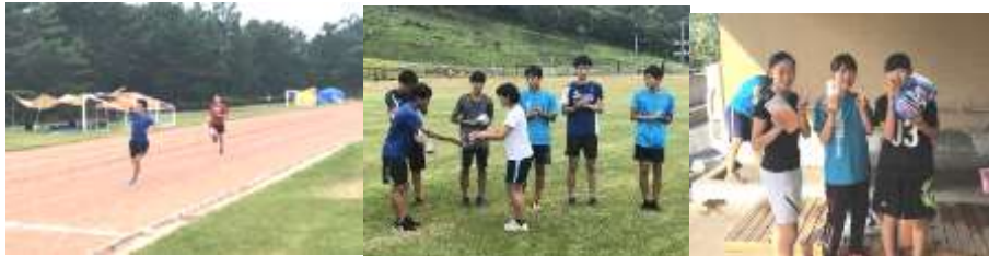
【最終日のエンドレスリレー/八ヶ岳杯の表彰/プロテインや栄養管理を司るマネージャー陣】

この合宿で一人一人が大きく成長することができました。それは、いつも支えてくださっている顧問の先生、練習できる環境を用意して下さった宿の方々、合宿に参加させてくれた家族、共に成長できた仲間のおかげです。感謝の気持ちを忘れずにこれからも頑張っていきます。