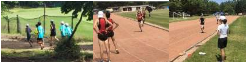
【中長はクロカンによるハケ岳杯、LT走、現地での他校との合同練習など充実しています】

跳躍ブロックでは、プライオメトリクストレーニングによって伸張反射を向上させる練習をしました。それによって踏み切りでの瞬発力を鍛えることが出来ました。