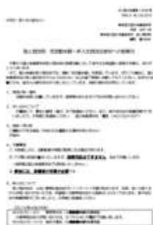
新入生へのご案内と3月の活動予定