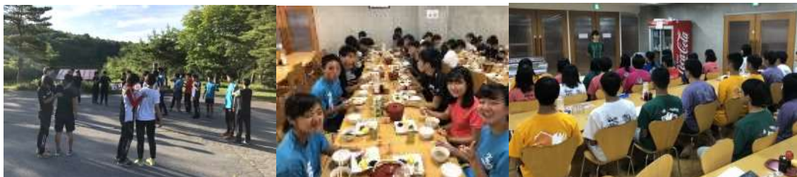
【朝のペイトレーニング/食事の一場面/夜の全体ミーティングの様子】

チームメイトが走っているときの応援の掛け声は共に頑張ろうと思えるメッセージになりました。相手が頑張っているから自分も頑張れる、それこそがチームである意味だと改めて実感しました。