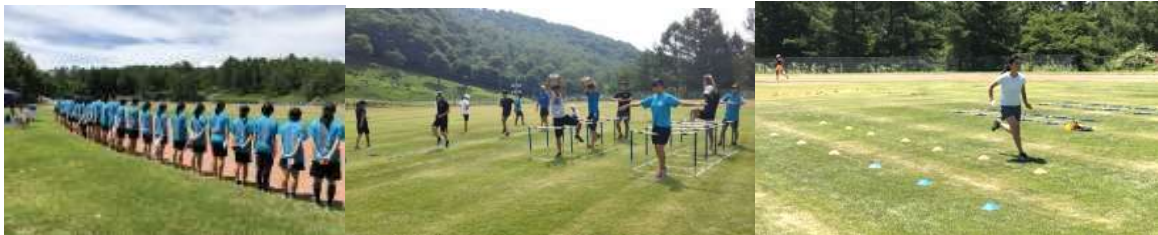
【ハードルドリルやマーク走によって動きづくりから丁寧にいきます】

短距離ブロックでは、いかに体全体を使って走れるかということを強化しました。技術練習では上半身と下半身がうまく連動しているか、母指球接地が出来ているかなどを意識していました。