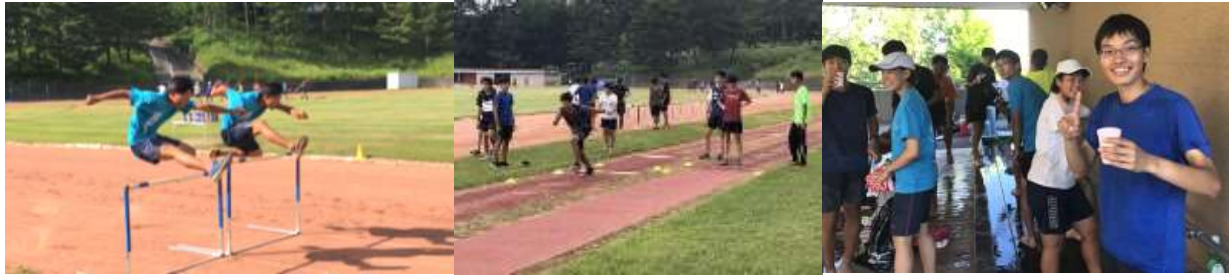
【短長の40秒走、ハードルの100本アプローチ、中長の5段跳びなども実施】

跳躍ブロックでは、プライオメトリクストレーニングによって伸張反射を向上させる練習をしました。それによって踏み切りでの瞬発力を鍛えることが出来ました。