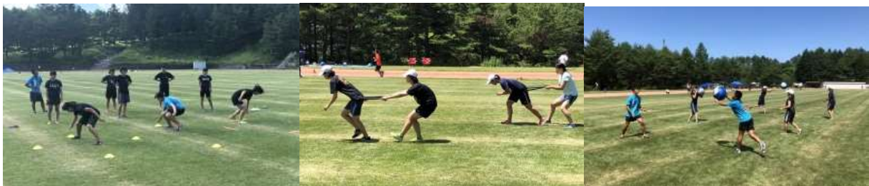
【神経系メニュー、チューブ走、ダイナマックスなどを用いて地面との関係や軸作りを意識します】

短距離ブロックでは、いかに体全体を使って走れるかということを強化しました。技術練習では上半身と下半身がうまく連動しているか、母指球接地が出来ているかなどを意識していました。