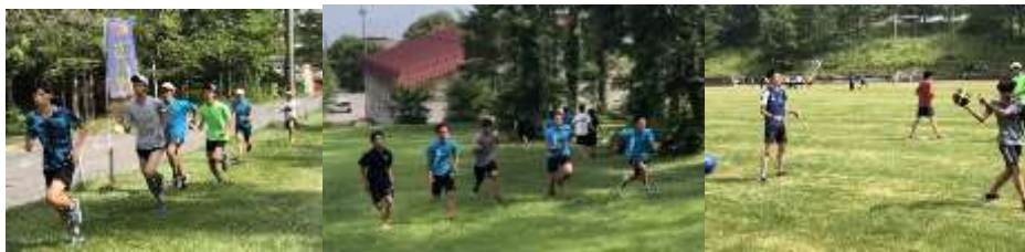
【中長は200m坂ダッシュ、短距離は50m坂ダッシュで追い込みます】

合宿という山を乗り越えて多くの技術を学び、身につけることが出来ました。しかし、それだけではなく「チーム力」を発揮できた場面もありました。