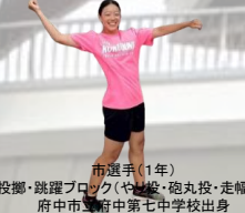
市選手(1年) 投擲・跳躍ブロック(やり・砲丸投・走幅跳) 府中市立府中第七中学校出身