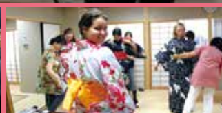
香港の高校生に折り鶴紹介