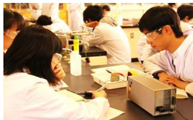
1・2年生の理科授業 (7割以上 観察・実験)

6年間を貫く課題研究・高度な理数教育 物理・化学・生物・地学の専門教員が指導 サイエンスカフェ オープンラボでの継続的な探究活動 日本地学オリンピック 世界大会金メダル ロボカップジュニア 世界大会第3位 科学の甲子園東京都大会第3位