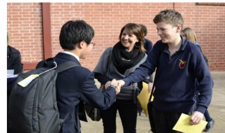
小石川生1人1家庭でのホームステイと現地校での授業参加