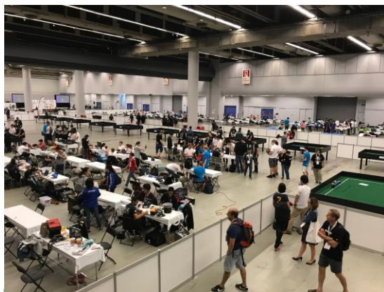
混沌とした試合会場