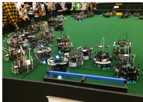
世界のロボット大集合