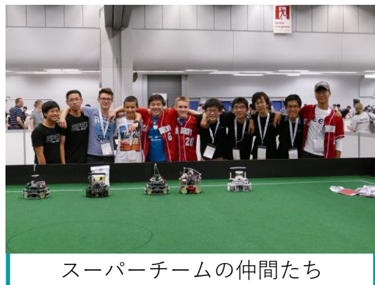
スーパーチームの仲間たち