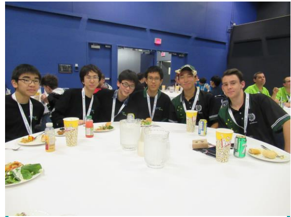
パーティー with オーストラリアチーム

この日はロボカップのシンポジウムに行き、人工知能の研究に関する公演を聞いたりポスターセッションを見てまわったりしました。ハードウェア担当の2人にとっては難解なものが多く、主にソフト担当が食い入って見ました。