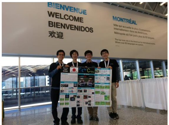
すべて終わって記念撮影