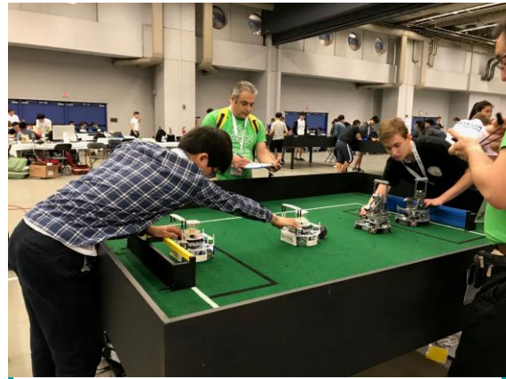
キックオフ直前の緊張シーン

その後スーパーチーム競技があり、私たちのロボットはゴールキーパーを務めました。何度か点を決められてしまい、負けてしまいました。