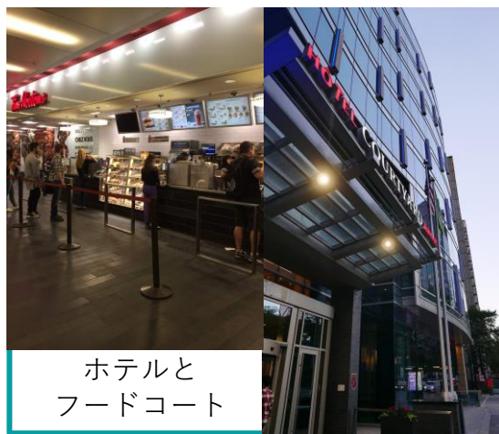
ホテルと フードコート

ホテルに帰ってからは焼けたモーターの修復を試みましたが、うまくいきませんでした。そこで作戦を変え、焼けたモーターを使わずに4輪の中3輪を使ってロボットを動かすことにしました。また、キーパー機のモーターは壊れていなかったため、キーパーとフォワードをチェンジし、フォワード機はしっかり動けるようにしました。初めての試みでしたが、夜中3時までの作業のおかげで、モーターの故障したロボットもキーパーとして何とか動くようになりました。