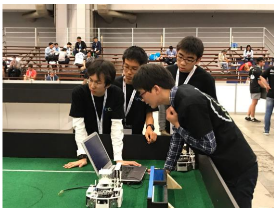
みんなでカメラの調整中