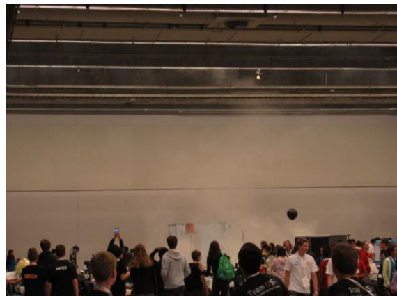
リポバッテリー爆発での白煙