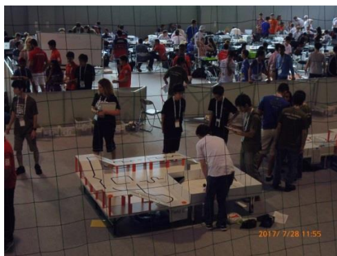
背水の陣で臨んだ二回目のトライアル。翌日は6回のトライアルが行われました。