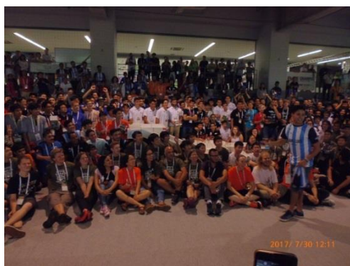
最終日前夜、やっとゆっくりと夕食です。世界中のロボカッパーが交流しました。