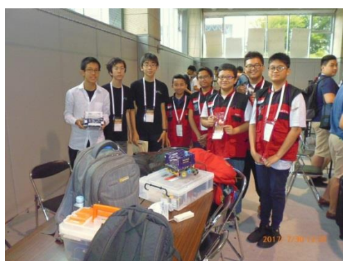
合同チームを組むインドネシア選手達と。スーパーチームに向け既に息もピッタリ。