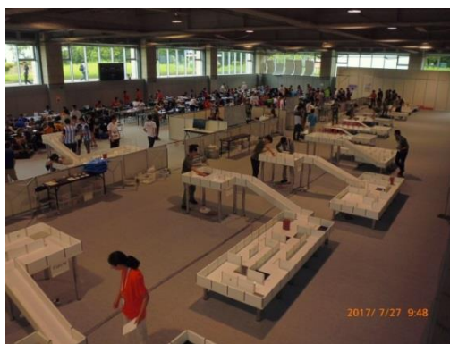
これが難易度の増した世界仕様のコース。手前は迷路の中を進む「メイズ」のコース。