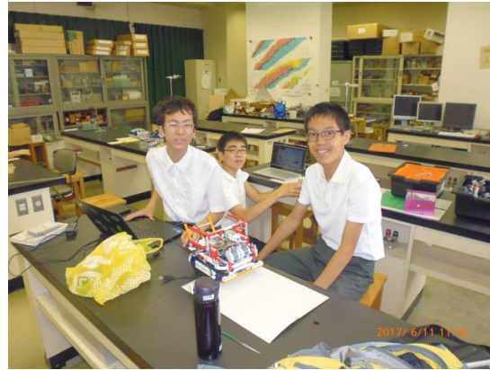
世界大会は全て英語。事前講習会の様子です。授業の無い土日には集中作業が欠かせません。