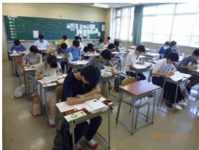
理論試験はマーク形式の90分で行われました。