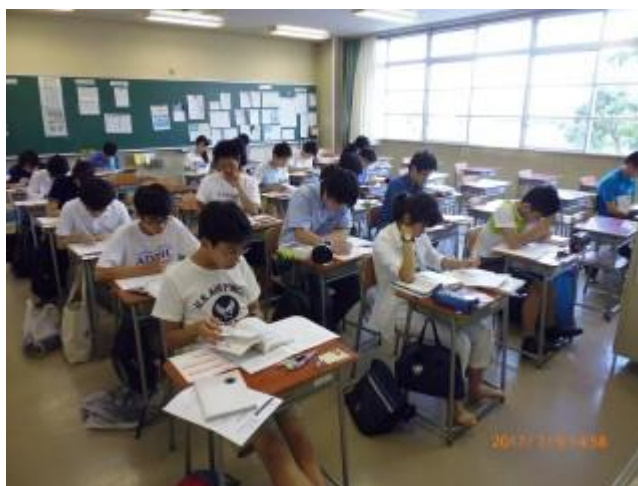
教科書・参考書などの持ち込みは自由です。