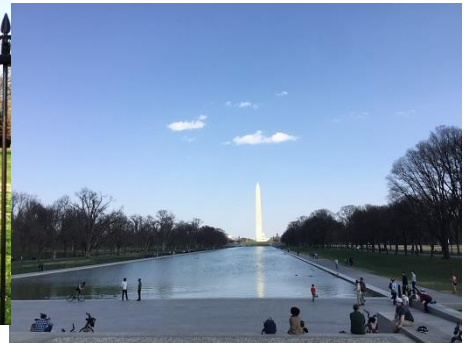
ワシントンモニュメント

この日たまたま大統領の乗った車が通るのを見ました。パトカーや白バイがエスコートしていてとても目立っていました。