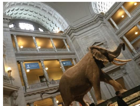
National museum of national history

どちらも展示品がホントたくさんあって、時間が全然足りませんでした。興味をひかれるものがたくさんで面白かったです。ちなみに無料です。ワシントン D.C.では博物館や美術館に入る際に荷物検査や機械を通るなどセキュリティ対策が厳しいです。