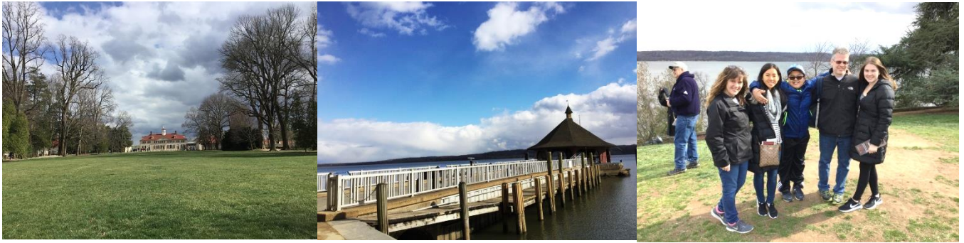
Mount vernon ジョージワシントンが住んでいたお家

家の中までガイドありで入ることができます。とても広くて、きれいでした。夜ごはんもそのレストランで食べました。料理はほんとおいしくて、アメリカに来てから食べたレストランで一番でした！(笑)