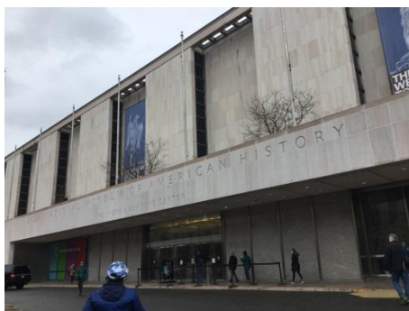
National museum of American history