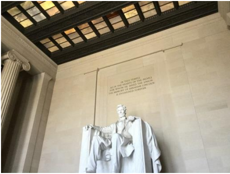
リンカーンメモリアル