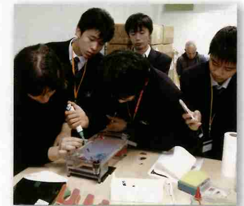
アデレード大学で遺伝子組み換えの結果を確かめる電気泳動の実験を行った。

GIHSのIBコースでは、独立心と社会性を身に付けた生徒を育成することを重視しています。理数系の授業への参加だけでなく、GIHSの生徒との関わりを通してリーダーとしての意識も向上しました。その他に、アデレード大学での実験や南オーストラリア大学のプラネタリウムでの講義にも参加しました。