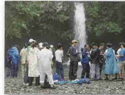
陣馬の滝で水質調査