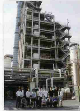
プラスチックをリサイクルしガス化した後、アンモニアを合成する施設→