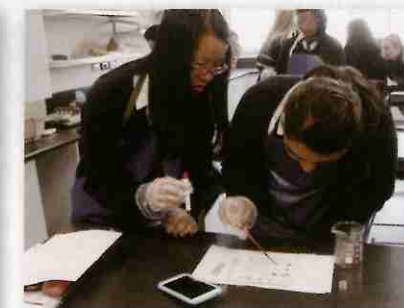
予測したことを実験で検証するIB生物の授業