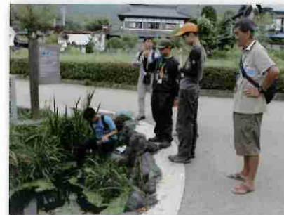
忍野八海・鏡池 水質調査