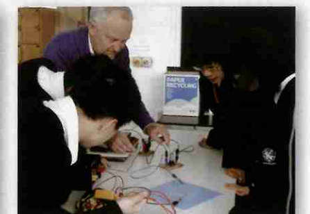
IB物理の授業では実験の結果をパソコンに入力し、グラフを作製して結果を分析