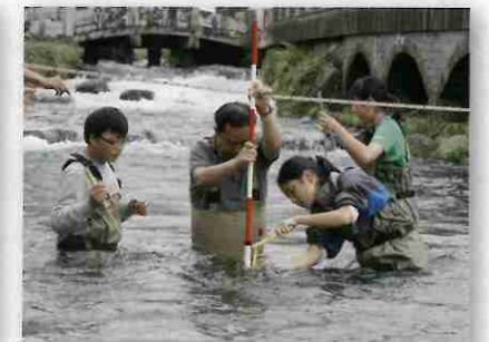
神田川で流量調査を行う