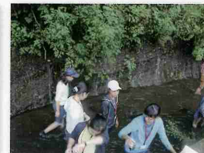
棚頭の湧水 帯水層の観察 水質調査