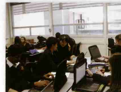
グレナンでは、どの授業も一人一台パソコンを使う。これはIB化学の授業