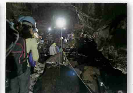
駒門風穴 溶岩のようすを観察