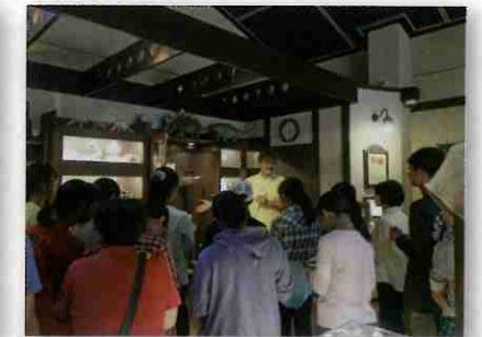
コンニャク石の説明(奇石博物館)