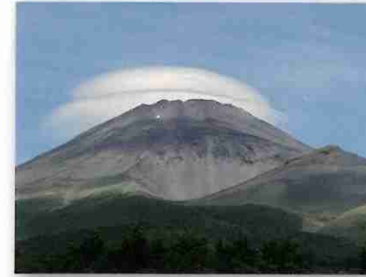
水ヶ塚公園より望む富士山と宝永山