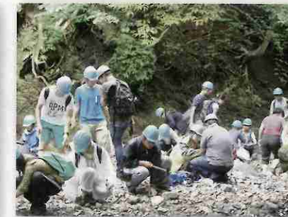
ハンマーで石を割り黄鉄鉱を探す