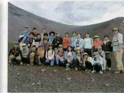
宝永第1火口と宝永山