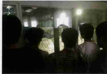
化学で学習したことと社会をつなげるプラント見学

5月26日に昭和電気(株)川崎事業所の見学会を行いました。有機化学、無機化学で学ぶ試薬や製品が製造される現場を見学して、授業で学習する知識を深めることを目的としました。化学の授業で学んだことが社会で実際に活用されていることや、プラントのスケールの大きさを実感することができました。