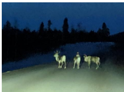
↑トナカイ 田舎道だとかなりの確率で出くわします。