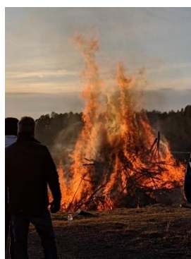
←ヴァルプルギスの夜 4月