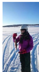
↑4月の始めに山岳地帯の山小屋に泊まりました。美しい眺めでした。