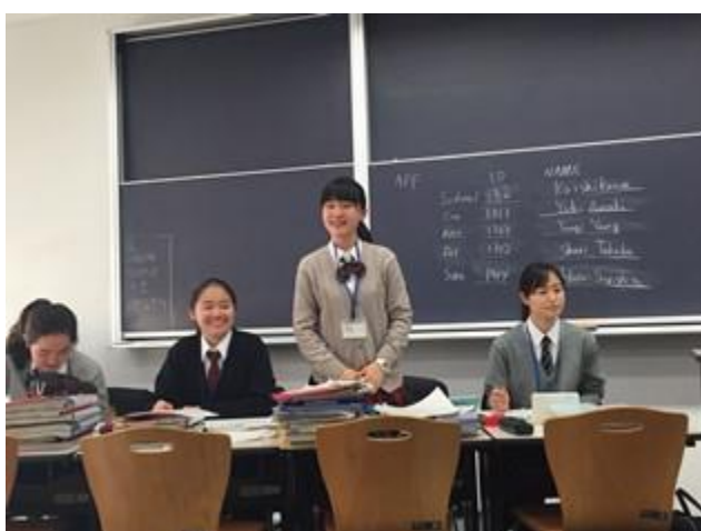
試合前の自己紹介の様子