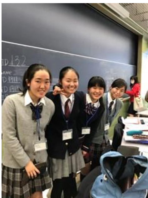
We are Koishikawa Debaters!!