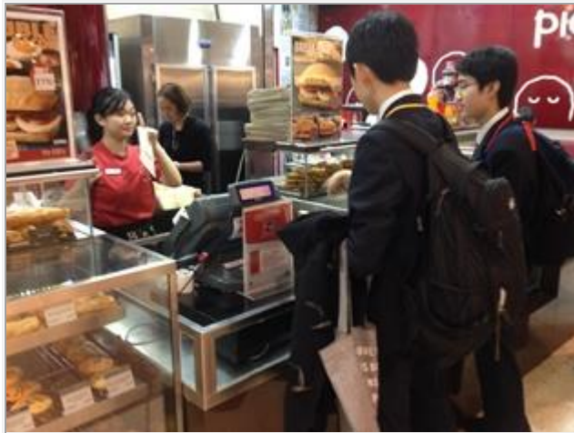
アデレードへの後発隊は、空港内での買い物で日常会話の練習をします。