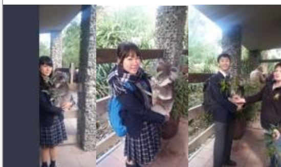
運良くコアラを触ることができました。