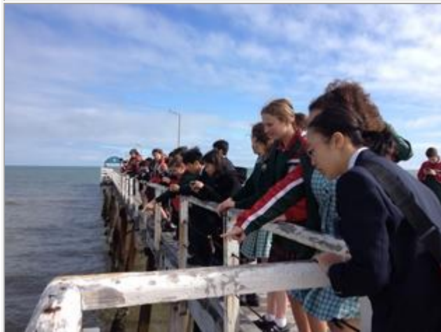
バディとの学校付近の散策です。 (G2 HENLEY 校)