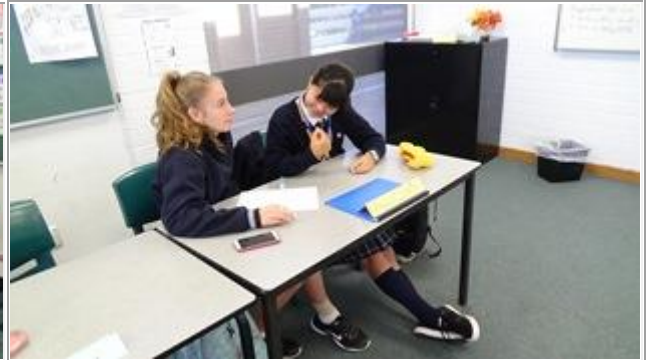
バディーと一緒に受ける授業は、英語を話すとてもいい練習になります。