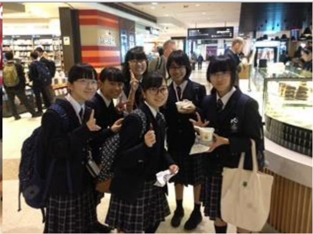
美味しいものを買えたようですね。