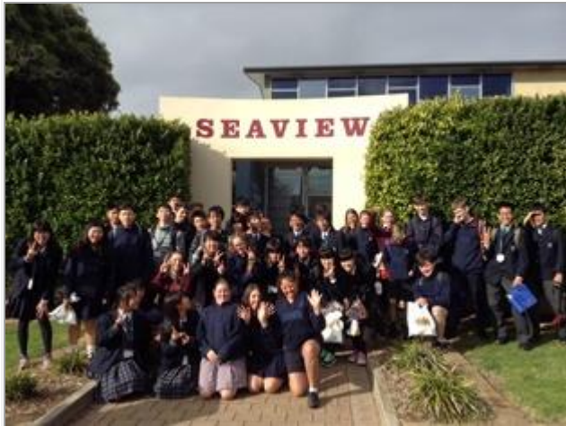
The Gorge Wildlife Park & Chocolate Factory に行ってきました。