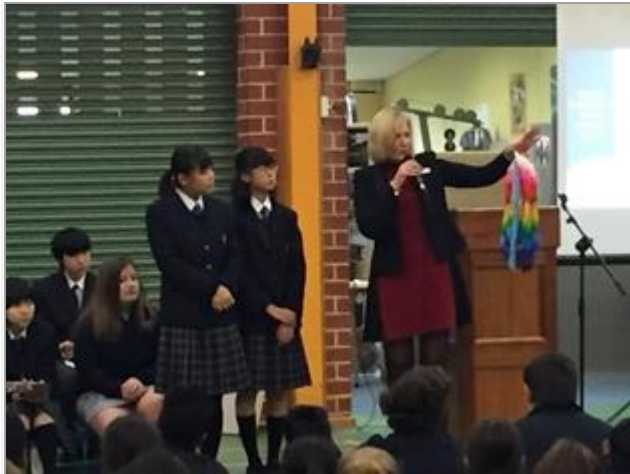
小石川生が千羽鶴をプレゼントしました。