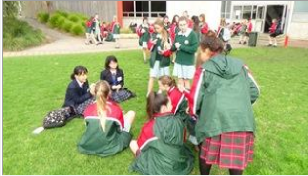
バディとの LUNCH TIME です。 (G2 HENLEY 校)

まだオーストラリア生活はスタートしたばかりです。様々な体験ができるようしっかりと研修して下さいね。