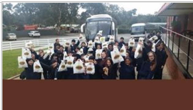
お土産買って、大満足の1日でした。