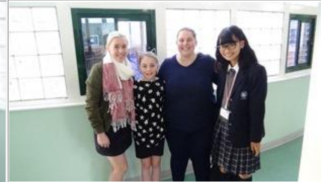
ホストファミリーとの対面です。よろしくお願いします。(G7 GOLDEN GROVE 校)