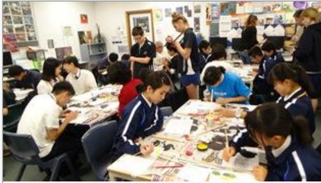
アボリジニ文化体験として、工芸品を作りました。