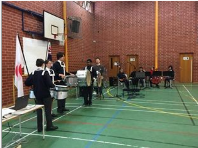
君が代を演奏してくれました。