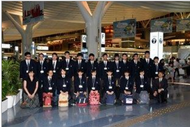
G5 GLENUNGA 校