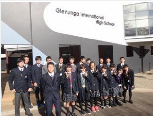
グレナング校をレポートします。