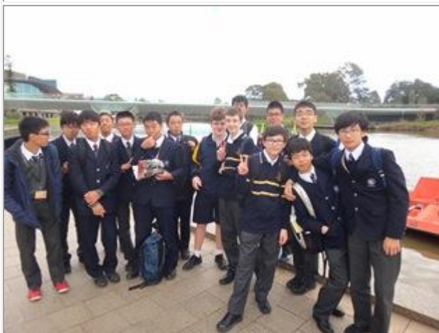
市内遠足の様子です。