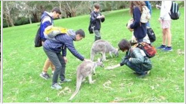
Cleland Wildlife Park では、南オーストラリア州に生息する動物を間近に見ることができます。