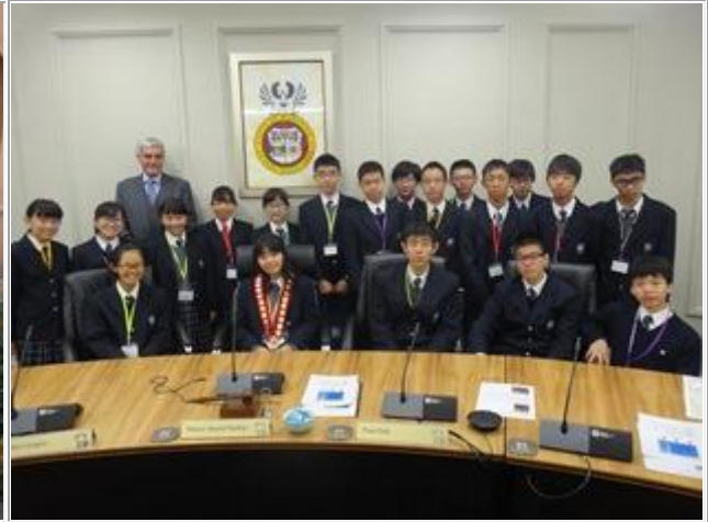
立派なイスに座りご満悦です。

今回は4校(Seaton 校、Wirreanda 校、Seaview 校、Glenunga 校)の報告をしました。 それぞれが充実した生活を送っています。