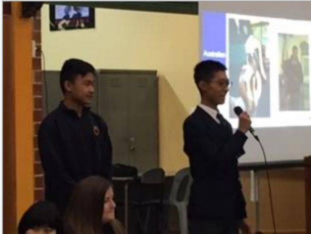
一人ひとりスピーチしました。