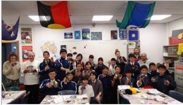
家にお土産として持って帰ります、お楽しみに！！