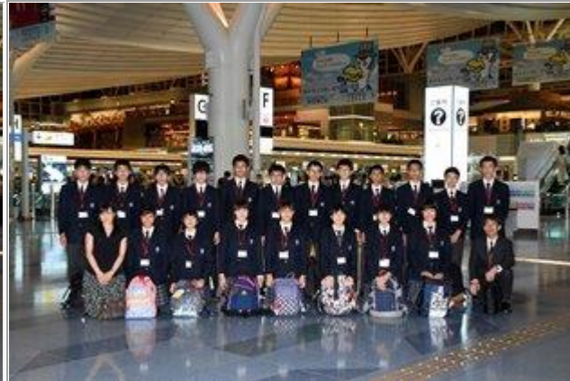
G6 NORWOOD MORIALTA 校