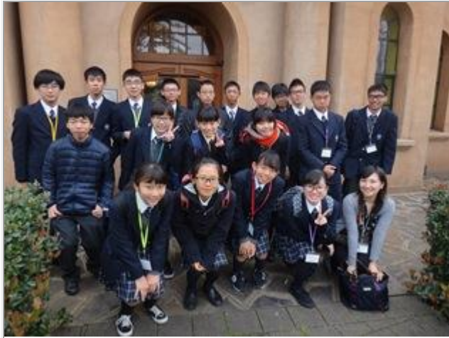
市庁舎を訪問しました。