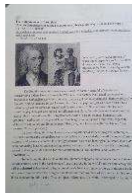
たくさんの資料を読みます

この時間はその名の通り、世界史を学びます。日本のようにノートをとることが中心の授業ではなく、先生の講義を聴き、テキストを読みつつ、クラス内で先生が出す質問に対しての答えをディスカッションするという形式です。この時間では地域ごとの勉強もしますが、地域ごとの勉強よりも世界の国々のつながりが重要視されています。そのため、時系列ごとに学ぶのではなく、時間でいくつかに区切ってテーマに沿ってどこで何が起こったのかを学びます。先生が面白く、講義を聴いているだけでも楽しいです。今は 1800 年あたりを勉強しています。最近では世界各地で起こった革命についてグループごとに分かれて学び、革命に沿った国歌、国旗のアイデアのプレゼンテーションを行いました。より広い視点で、現代とつながっていることを考えながら世界史を学ぶことができ、興味深いです。また日本が歴史的にどのような立場なのかを学ぶことができ、今までとは異なった視点で日本史を考えることができる良い機会だと感じています。