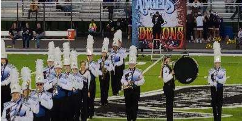
↑マーチングバンド

少し短いですが、今回はこの辺で終わらせていただきます。最後まで読んでくださり、ありがとうございました。