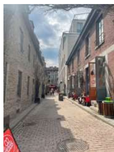
↑オシャレな街並みでした