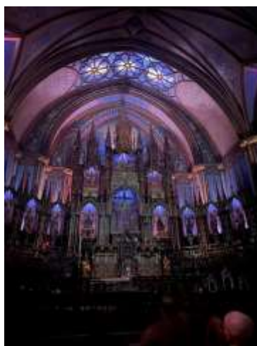
↑ライトアップが美しかったです。