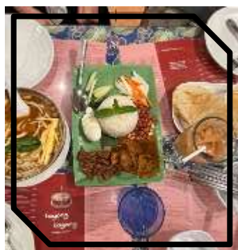
←San Francisco で食べた マレーシア料理

また、19日からは2泊3日でサンフランシスコに旅行に行ったり、次の週末には Balboa Park という本当に大きな公園に連れて行ってってくれたりしました。