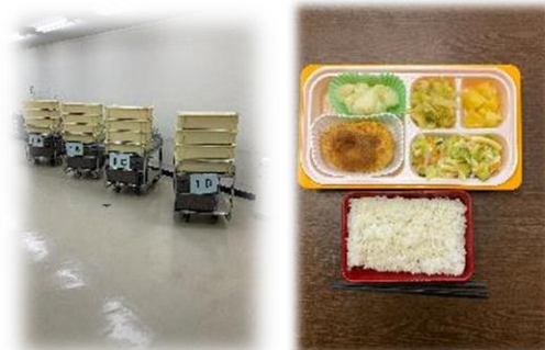
ランチボックス (写真は4/16分) 前期生(1~3年生)対象