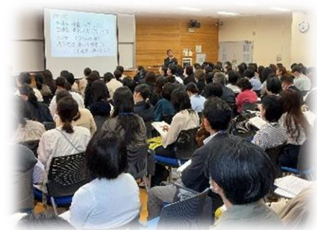
2年生(4/12)・5年生(4/15)保護者会 多くのご参加ありがとうございます