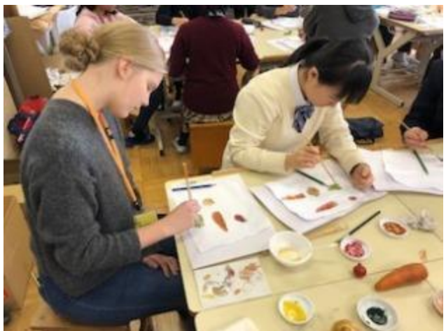
3・4校時は美術の授業です。 野菜を題材に絵の具を使って絵を描きました