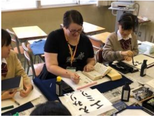
漢字だけでなく、ひらがなやカタカナにも挑戦しました