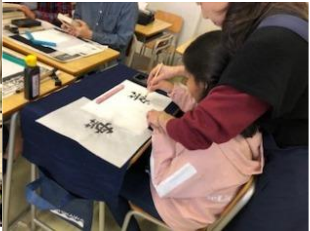
書道の先生に筆使いを教えてもらっています