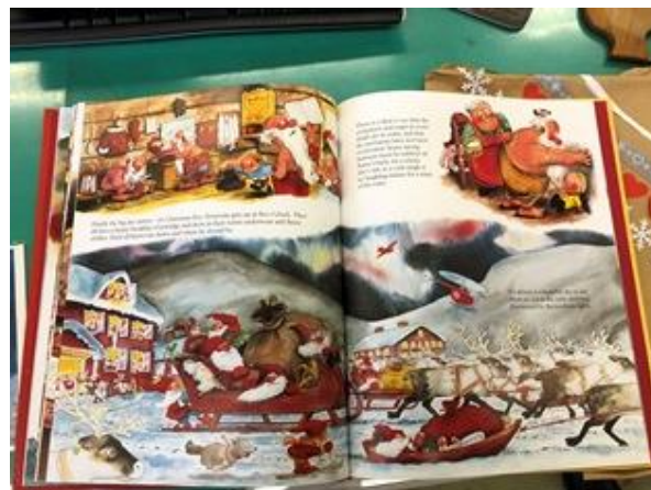
フィンランドからのお土産でサンタクロースの絵本をいただきました