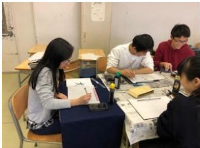
書道の授業です。漢字の練習をしています