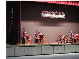
和太鼓部 雲蒸龍変和太鼓部