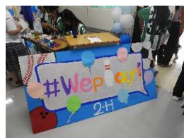
2H We play