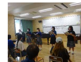
合唱部 スマイル コンサート