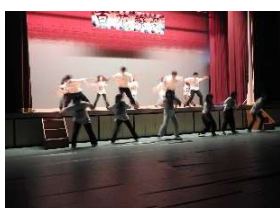
35F ダンス部 Flavors