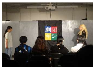
演劇部 黒シンデレラ