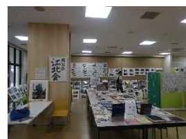
同窓会 (江北会) 展示