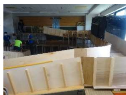
2D ジェットコースター