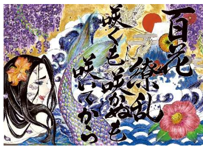
パンフレット 裏表紙