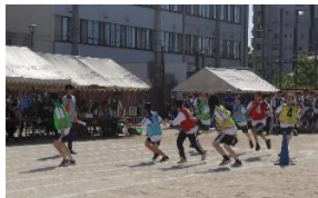
女子 色別対抗リレー