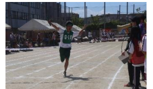
2年クラス選抜リレー ゴール!