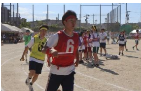
男子 色別対抗リレー