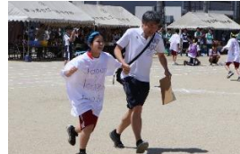
借り物競争 国語の先生