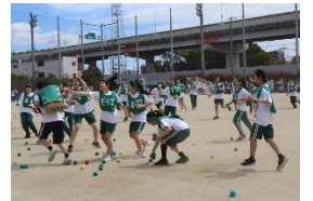
2年女子追いかけ玉入れ