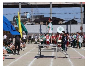
閉会式 実行委員長講評