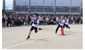
3年クラス選抜リレー