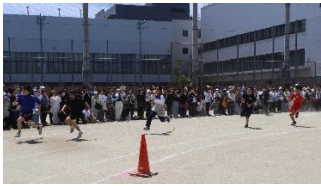
クラブ対抗リレー男子