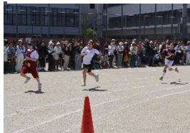
クラブ対抗リレー女子