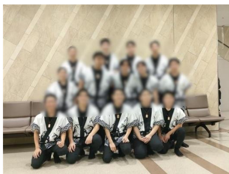
演奏後の集合写真