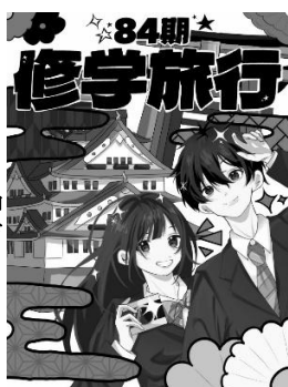
しおり表紙イラスト E組 初見さん作成

1日目は神戸を訪れ、阪神・淡路大震災とその復興の軌跡に触れ、災害への見識を深めることができました。2日目は班別に計画した大阪の訪問先で、関西特有の歴史・文化等に触れ視野を広めました。最終日は京都で各種体験を通じ文化探究学習を深めました。