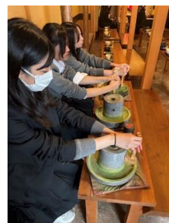
抹茶作り体験 (三星園上林三入本店)