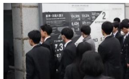
震災メモリアルパーク