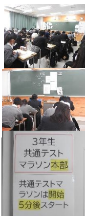
3年生 共通テストマラソン本部 共通テストマラソンは開始5分後スタート