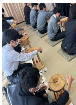
安達組み紐作り体験 (安達組み紐館)