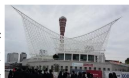
神戸ポートタワー (海洋博物館前)