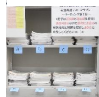
英語演習問題冊子