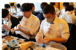
京菓子作り体験 (八つ橋庵とししゅう館)