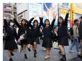
道頓堀 グリコサイン