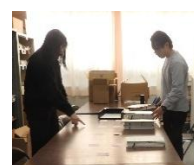
共通テストマラソン 本部・問題準備