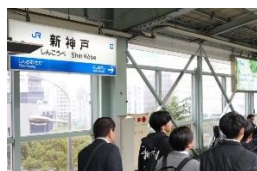
新幹線新神戸駅 到着