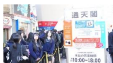
新世界 通天閣入場口