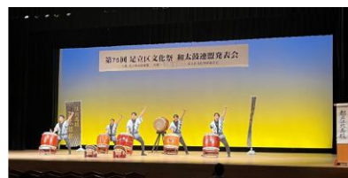
足立区和太鼓連盟発表会

○第75回足立区和太鼓連盟発表会 11月9日(日)西新井文化ホール で3曲発表しました。外部での公式 初舞台の多数の1年生も好演奏で した。(下段写真)