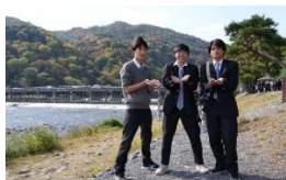
嵐山散策 (渡月橋を背に)