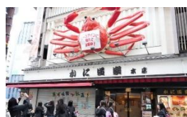
道頓堀 かに道楽本店