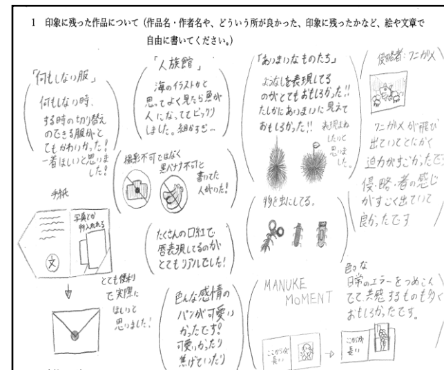
↑2G生徒のレポートより

◎ちょっとした面白い仕掛けとかも工芸祭に取り入れられたらお客さんももっと喜ぶと思 いました！自分らしさを出せる作品を作っていきたいと思いました！(2G生徒)