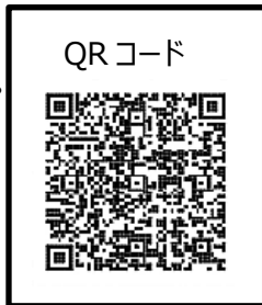
オンライン申請システムを利用した申請の主な流れ