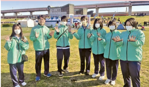
かつしかふれあいRUNフェスタ