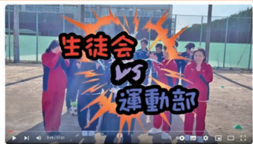
【葛飾商業全日刊】生徒会と運動部がスポーツ二難関角！？【Youtube甲子園】