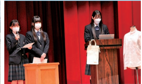
東京プランニング・ラボ