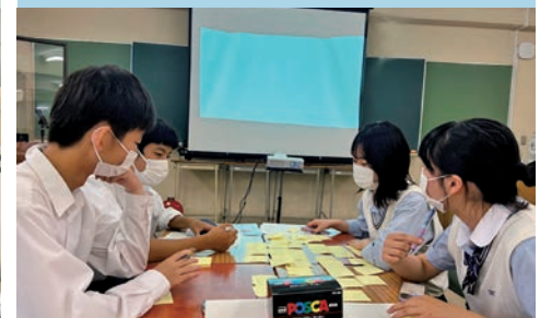
商業教育コンソーシアム東京