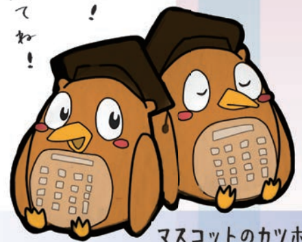
マスコットのカツホー