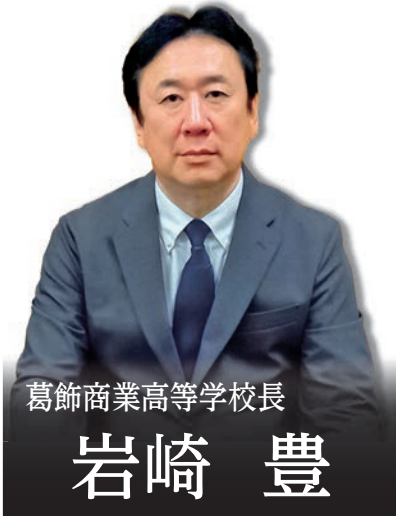
葛飾商業高等学校長

従来の資格取得の他、ビジネスに関する実学を中心とした様々な教育活動を通し、思考力・判断力・表現力を磨きます。また、自身で課題や問いを設定し、探究的な見方・考え方を働かせて学習を進める「ビジネス探究学習」も積極的に行い、グローバル社会で求められる様々な能力を身につける教育を推進し、人間性豊かな生徒の育成に取り組んでいます。