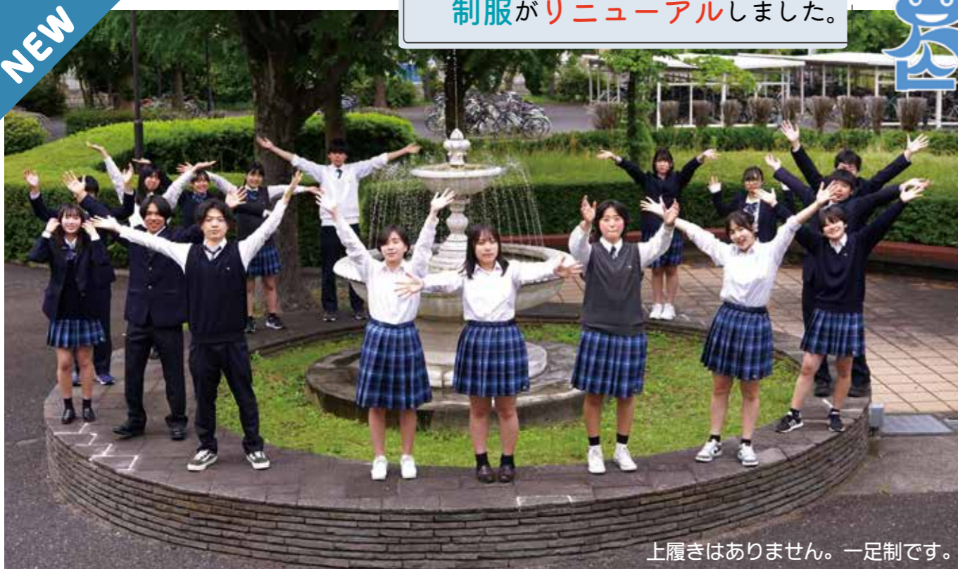
上履きはありません。一足制です。