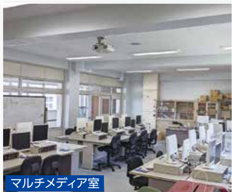
マルチメディア室