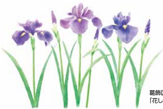
葛飾区の区花 「花しょうぶ」