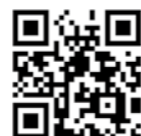
公式 X (旧 Twitter)

※諸事情により中止、または延期になる場合があります。必ずHPにて最新情報をご確認ください。