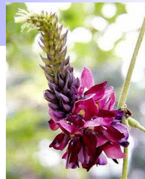
校章の由来 葛（くず）の花

本校は、自己の能力を生かし、社会人として自立できる健全な生徒の育成を目指しています。