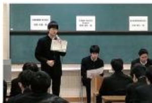
卒業生による講話