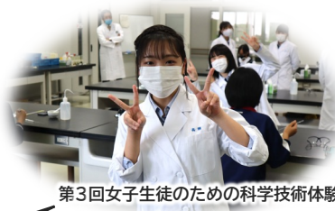
第3回女子生徒のための科学技術体験