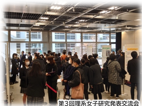
第3回理系女子研究発表交流会