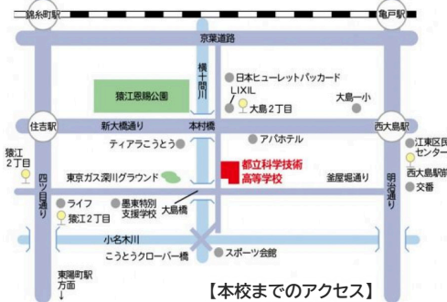
【本校までのアクセス】